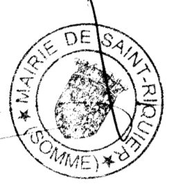
Planche 1 : ensemble de la commune

VU POUR ETRE ANNEXE A LA DELIBERATION DU CONSEIL MUNICIPAL EN DATE DU : 18 AVR 2011